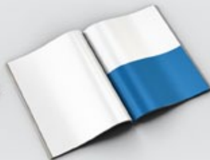
1/2 Página 14 x 21 cm