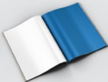
1 Página 21 x 28 cm