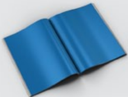
Página Dupla 42 x 28 cm