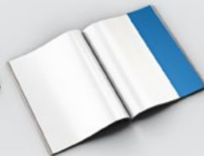
1/4 Página (rodapé) 10 x 13 cm